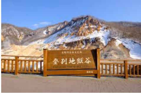
Công viên Jigokudani (thung lũng địa ngục) dấu vết của núi lửa phun trào