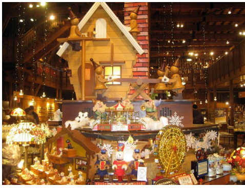
Bảo tàng hộp âm nhạc Otaru với hơn 3000 hộp âm nhạc đủ kích cỡ