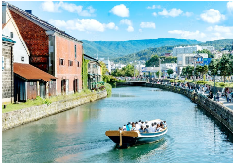
Trải nghiệm đi thuyền trên kênh Otaru.