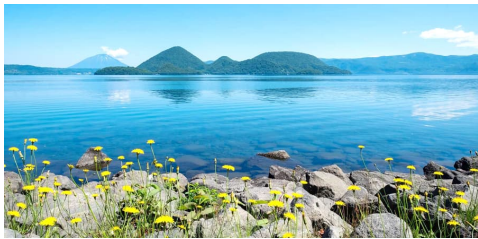
Khám phá Hokkaido - 1 trong 4 hòn đảo được mệnh danh là đẹp nhất Nhật Bản